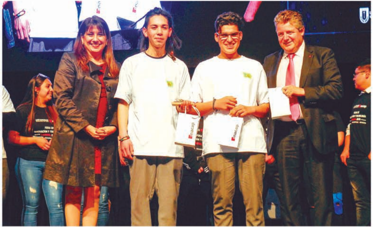
Equipo ganador del concurso del Liceo Politécnico de Cañete recibe su premio a manos de autoridades de la Universidad Tecnológica de Chile INACAP, Sede Concepción-Talcahuano.

Juego de mesa desarrollado por estudiantes de Cañete, logró el primer lugar en la competencia y representará a la Región del Biobío en la final nacional que se realizará en Santiago.