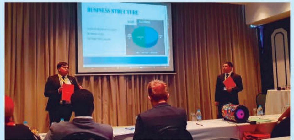
Presentación de "BECAV", proyecto ganador del concurso Go! Innova 2017, en la SAGE World Cup 2018, en la ciudad de Durban, Sudáfrica. Este concurso es una de las iniciativas con que la Universidad Tecnológica de Chile Inacap fomenta las capacidades emprendedoras a nivel escolar.

• Fomento del trabajo colaborativo: la generación de proyectos y la identificación de soluciones a problemáticas particulares será más provechosa si se fomenta el trabajo colaborativo, no