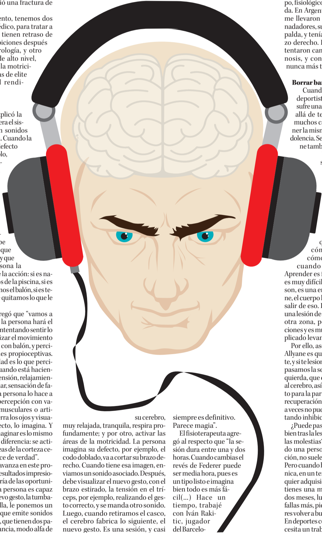
ILUSTRACIÓN: ANDRÉS OREÑA P.

¿Puede pasar que alguien se sienta bien tras la lesión y luego reaparezcan las molestias? "Normalmente, cuando una persona levanta una inhibición, no suele volver al estado inicial. Pero cuando haces un cambio de técnica, en un tenista por ejemplo, cualquier adquisición se puede perder. Si tienes una muy buena derecha por dos meses, luego la percibes menos, fallas más, pierdes confianza, y quieres volver a buscar la buena sensación. En deportes como el golf o tenis, se necesita un trabajo diario", dijo.