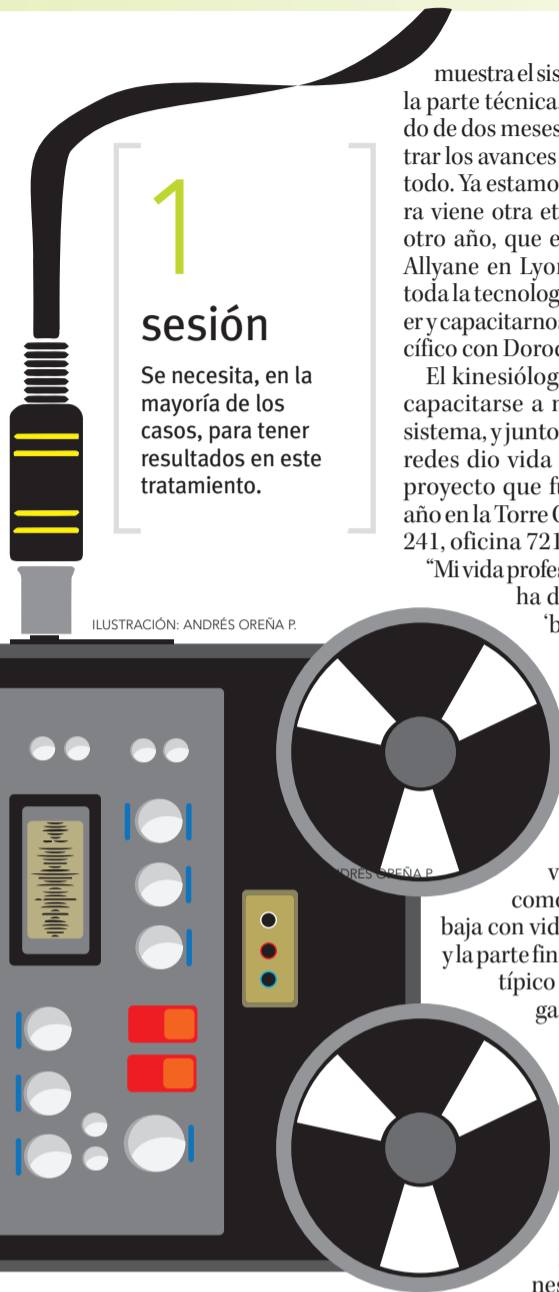
ILUSTRACIÓN: ANDRÉS OREÑA P.

EL SISTEMA tiene como elemento central Alphabox , método que trabaja a nivel cerebral con sonidos de baja frecuencia.