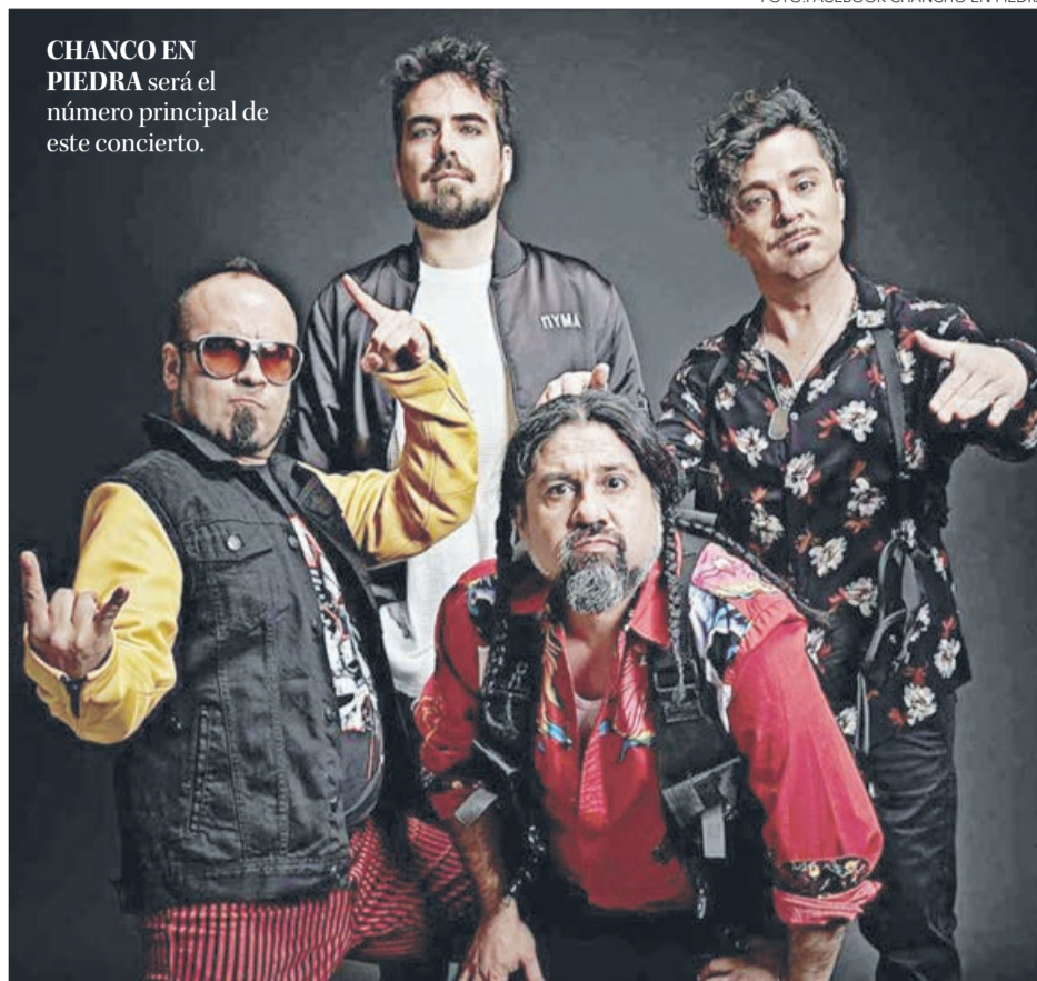
CHANCO EN PIEDRA será el número principal de este concierto.