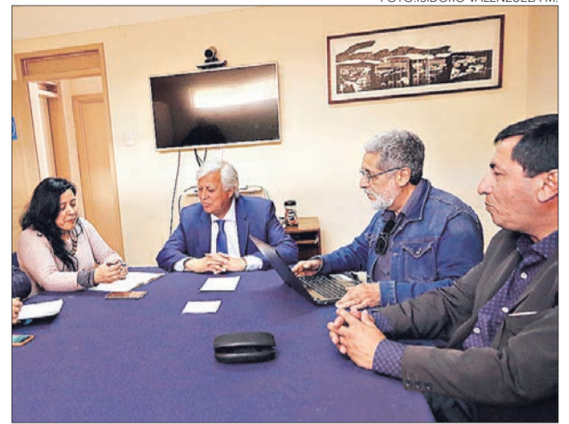
LAS DENUNCIAS BUSCAN visibilizar los maltratos.

“Existe un problema por parte del Gobierno a la hora de selección del personal que dirige una seremi y que se preocupará por los derechos de los trabajadores”, señaló el diputado.