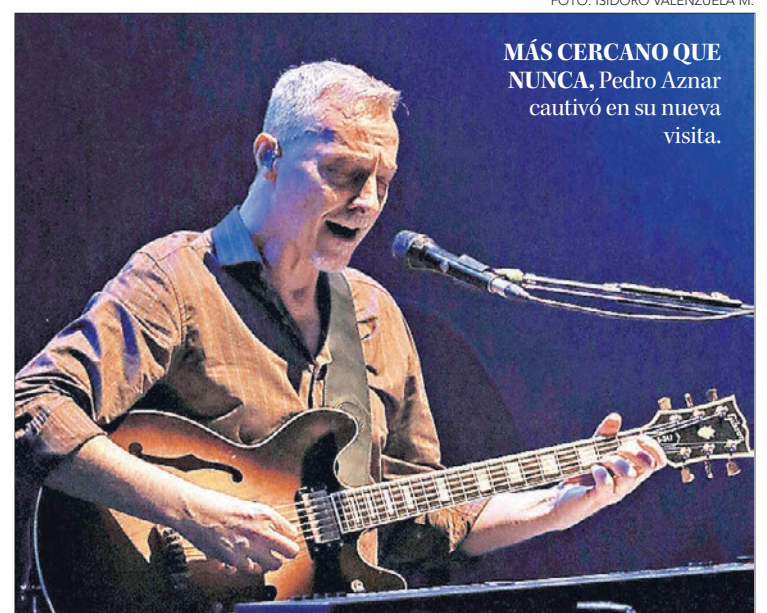
MÁS CERCANO QUE NUNCA, Pedro Aznar cautivó en su nueva visita.

Al final, no podían faltar “Quebrado”, “A primera vista” y “No hay forma de pedir perdón”, como siempre coreados en masa por el público. El mismo que ya se retiraba cuando el argenti-