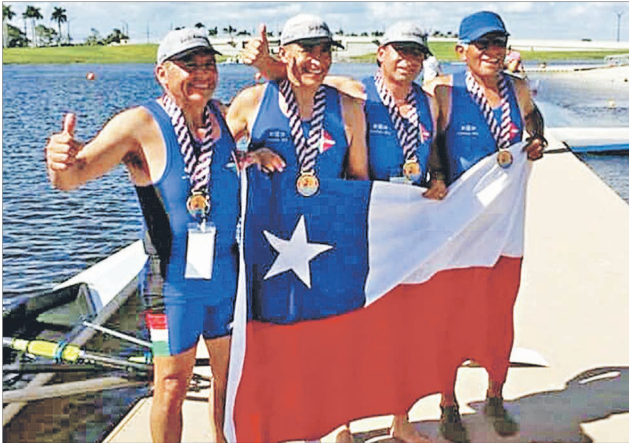
DELEGACIÓN REGIONAL DESTACÓ EN MUNDIAL DE REMO MASTER

La primera celebración llegó por cuenta del Cuádruple B, que se colgó el oro con participación de deportistas locales y del Club Los Mauchos, de Constitución. Luego fue el turno del Cuádruple C,