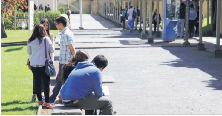
CERCA DE 8 mil estudiantes en pregrado concentra en sus aulas la Ucs.

En estos días, la Ucs se dará luz verde a la inscripción de listas de cara a la elección de Federación Estudiantil fijada para el cierre del año.