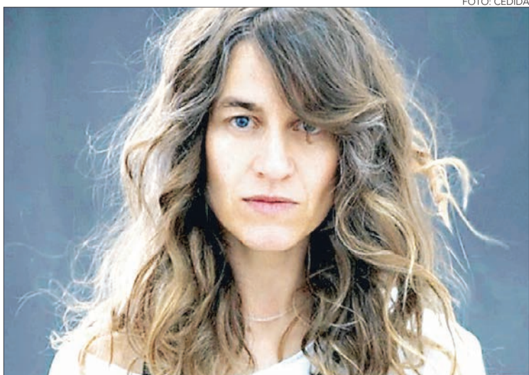
LA CANTANTE Y guitarrista será el número principal de los festejos.

Twitter @DiarioConce contacto@diarioconcepcion.cl