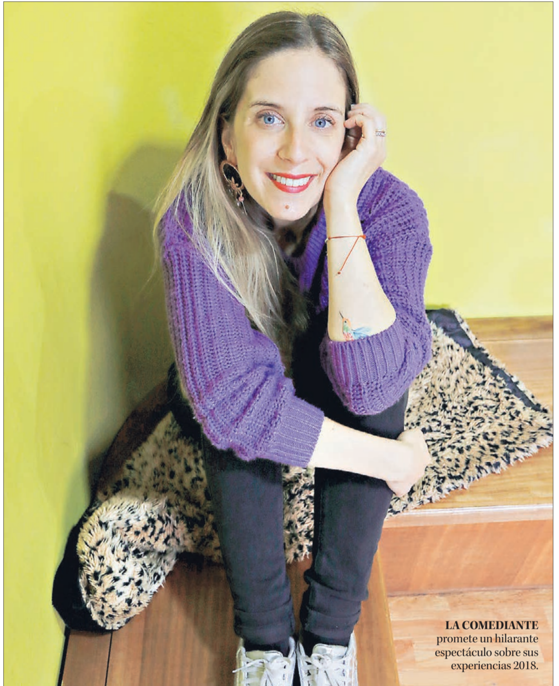
LA COMEDIANTE promete un hilarante espectáculo sobre sus experiencias 2018.