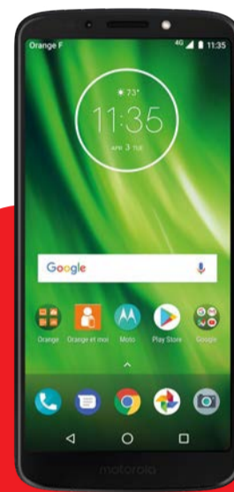
MOTOROLA G6 PLAY

Plan incluye 45 GB + Minutos Libres (a 300 números)