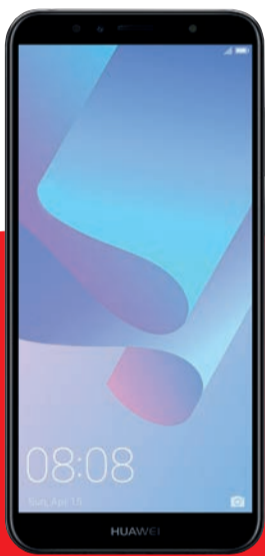
HUAWEI Y6 2018

INCREÍBLES EQUIPOS CON PIE $0 Y EN 12 CUOTAS