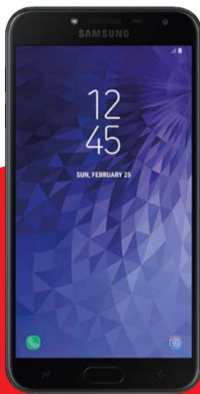
SAMSUNG GALAXY J4

Plan incluye 35 GB + Minutos Libres (a 300 números)