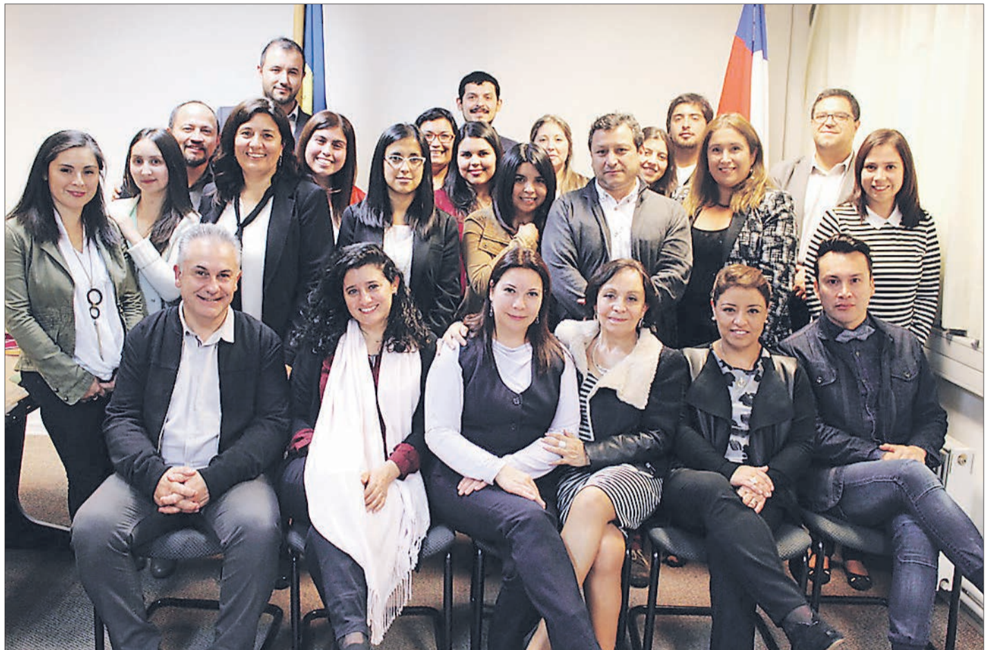
MAGÍSTER EN INTERVENCIÓN FAMILIAR UDEC

Para acceder al Magíster en Intervención Familiar de la UdeC es necesario cumplir con una serie de requisitos que son básicos dentro del proceso de postulación. Lo primero es ser licenciado o pro-