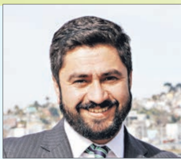
Jorge Ulloa, Intendente del Bío Bío

“Anfp nos dijo ‘¿cuánto ustedes están dispuestos a poner?’. No me parece justo que descansen en el trabajo de los municipios”.