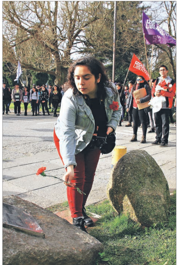
ROMERÍA Y HOMENAJE a los caídos al interior de la Universidad de Concepción.

en el contexto de la celebración de las fiestas patrias, creo que más que nunca tenemos que levantar los símbolos de unidad, y los símbolos de unidad no pasan por creer que somos los únicos defensores de los Derechos Humanos, aquí tenemos que tener conductas de defensa más allá de un pabellón", añadió.