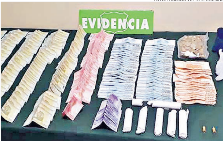
CARABINEROS recuperó el dinero sustraído.