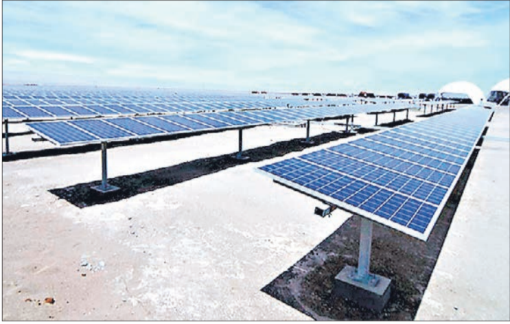
ES UNA FUENTE renovable de energía no explotada hasta ahora en Bío Bío.