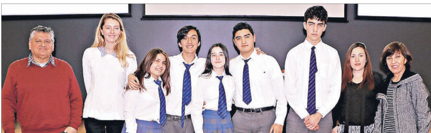
ALUMNOS del Colegio Fraternidad.

Demostando sus conocimientos, los equipos de cinco establecimientos de educación media del Bío Bío se enfrentaron en la fase regional de las Olimpiadas de Actualidad, organizada por la Asociación Nacional de la Prensa (ANP Chile) y el Centro de Desarrollo para la Educación Media (Cedem) de la Universidad INACAP, en colaboración con Diario Concepción. Esta edición tuvo como ganador al Colegio Fraternidad de San Pedro de la Paz.