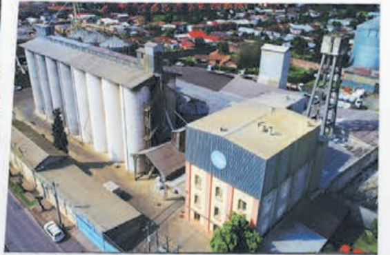
Planta San Fernando