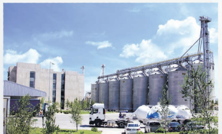
Nueva Planta Peñaflores