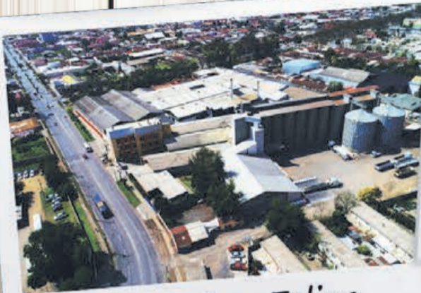
Planta San Felipe