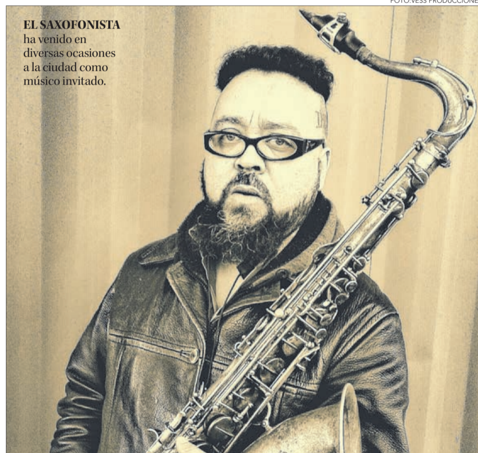
EL SAXOFONISTA ha venido en diversas ocasiones a la ciudad como músico invitado.