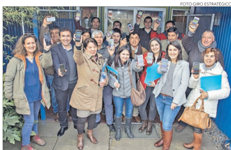
CON “NASAPP” vecinos de la planta podrán reportar eventos de olores.

Twitter @DiarioConce contacto@diarioconcepcion.cl