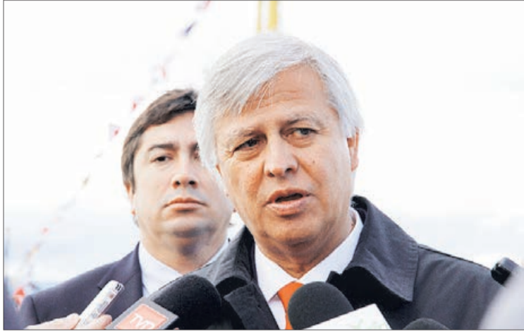
EL DIPUTADO dijo que se defenderá donde corresponde, en tribunales.