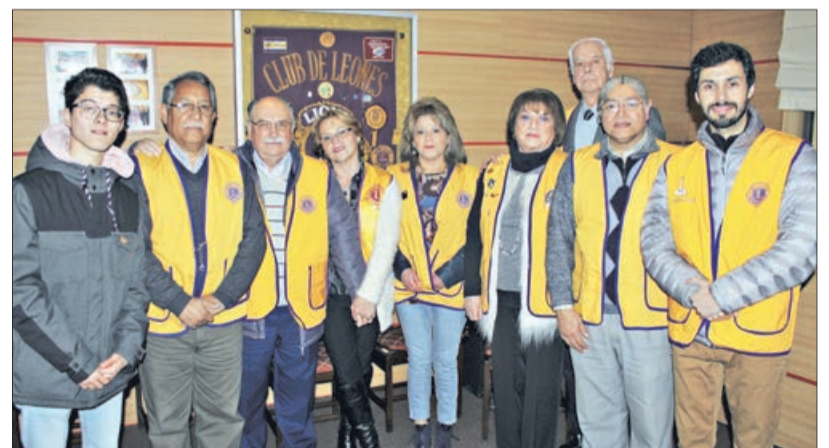
CLUB DE LEONES Concepción.