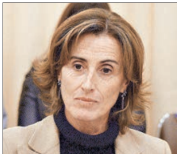
Marcela Cubillos cambió el ministerio de Medio Ambiente por el de Educación. Es militante de la UDI.