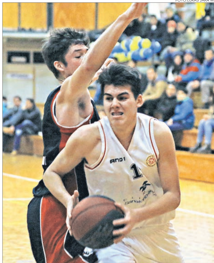
DE HABER UN tercer encuentro, se disputaría el domingo a las 18 horas en el Polideportivo germano.

Twitter @DiarioConcepcion contacto@diarioconcepcion.cl