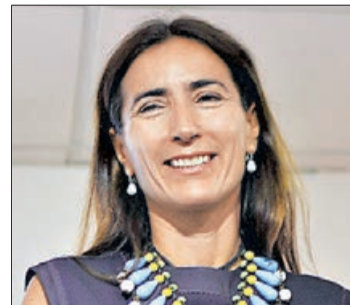
Carolina Schmidt estuvo en el anterior gabinete del Presidente Piñera, como ministra de la Educación y de la Mujer.