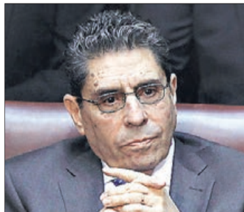
Ex parlamentario en Suecia, el escritor Mauricio Rojas, asumió como ministro de la Cultura, las Artes y el Patrimonio.