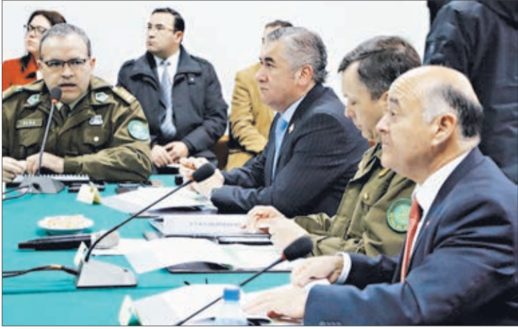
LAS AUTORIDADES presidieron la reunión.