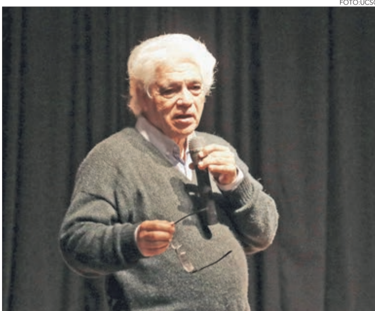
"AGRADEZCO cada día poder seguir tocando", indicó Bravo.

Pianista, además, presentó el libro "La música como puente entre el cielo y la tierra", basado en su obra.