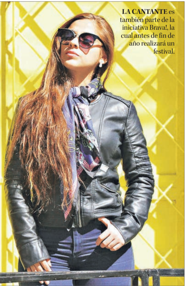
LA CANTANTE es también parte de la iniciativa Brava!, la cual antes de fin de año realizará un festival.