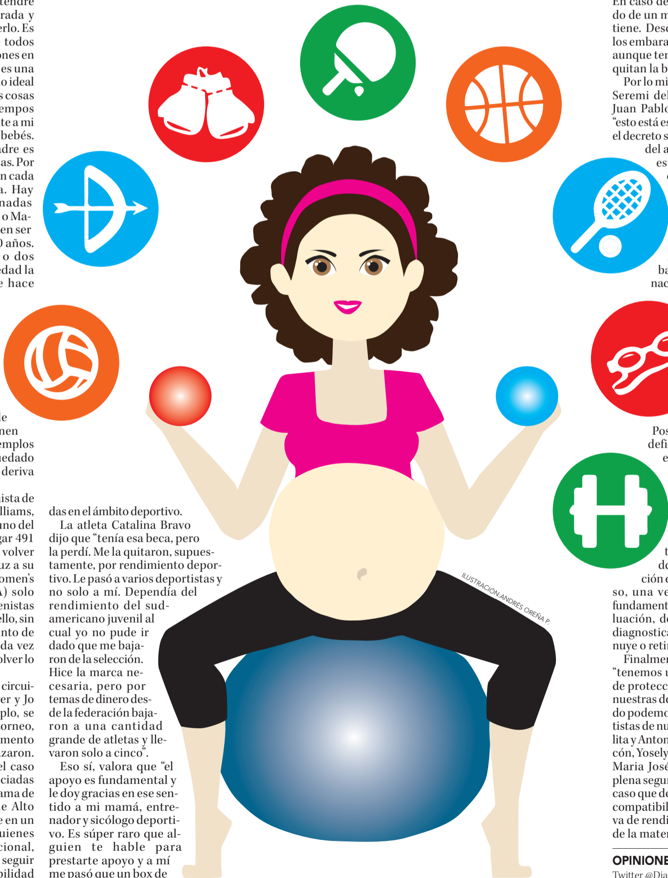
ILUSTRACIÓN: ANDRÉS OREÑA P.

Twitter @DiarioConce contacto@diarioconcepcion.cl