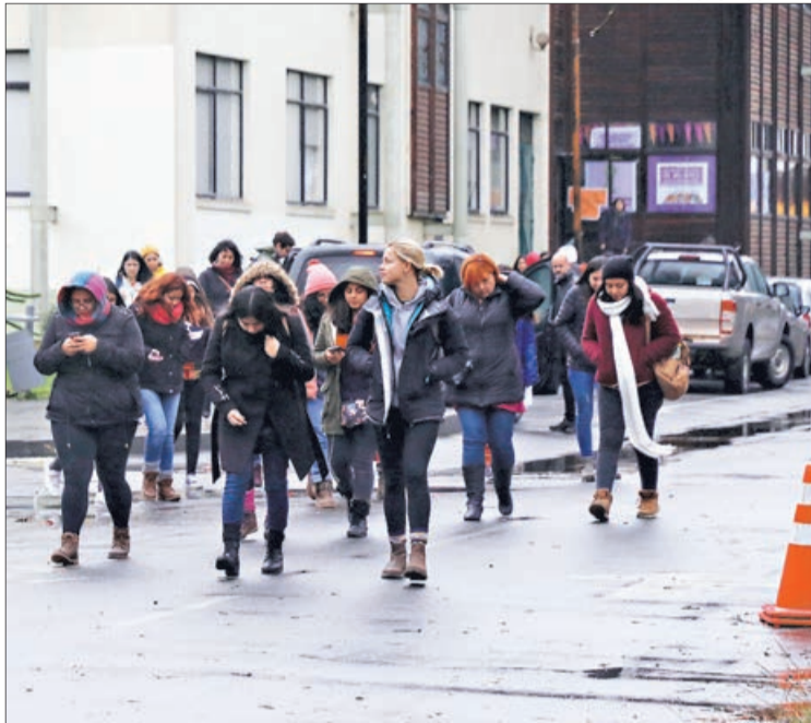
SIETE SEMANAS movilizada completará en los siguientes días la UBB.