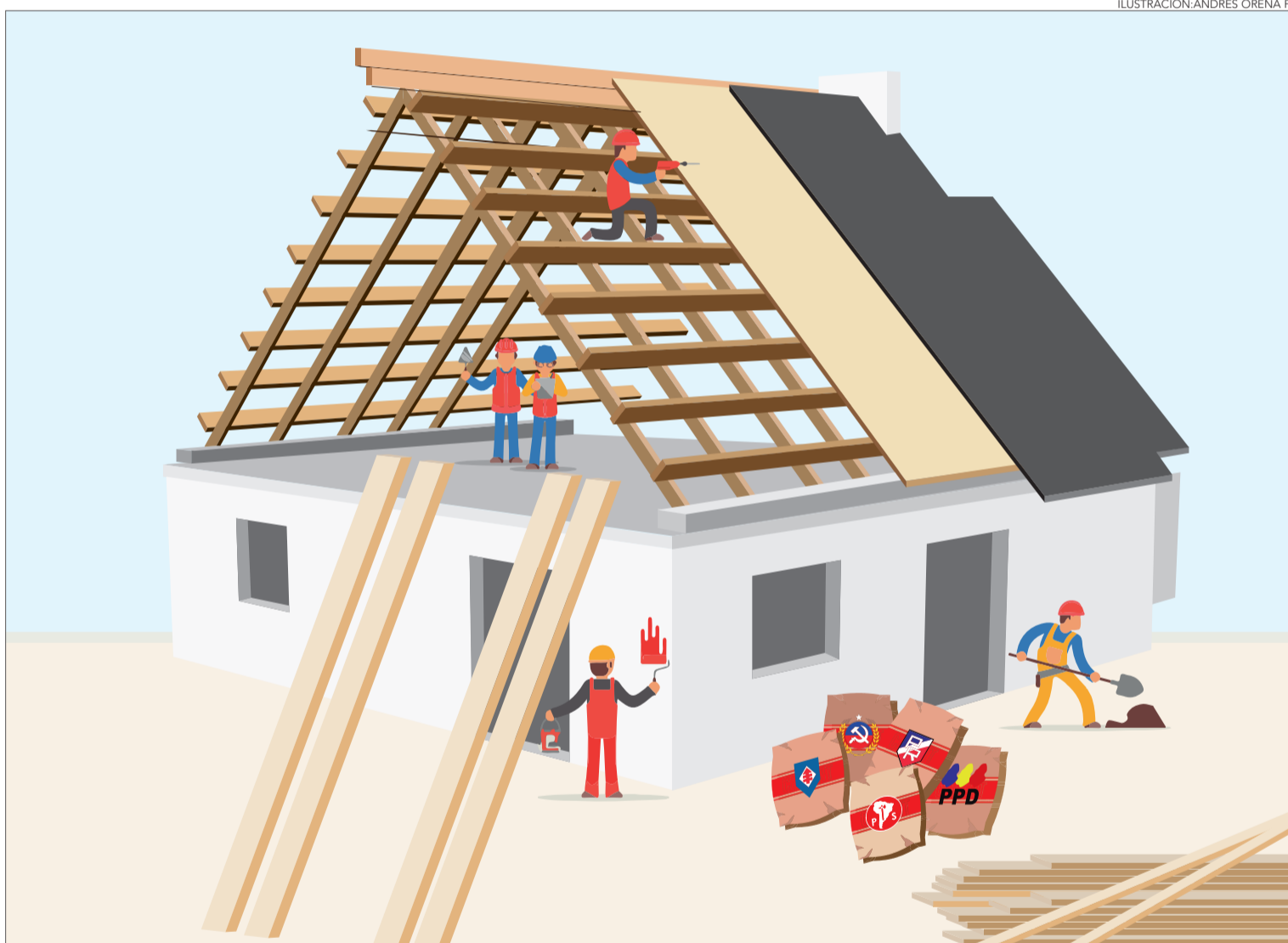
ILUSTRACIÓN: ANDRÉS OREÑA P.

Hauri insistió en que el trabajo opositor hoy se enmarca dentro “de la construcción de una propuesta de relato regional como base programática de un posterior entendi-