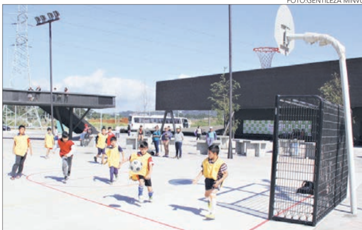
BARRIO CÍVICO de Boca Sur incluyó áreas deportivas.