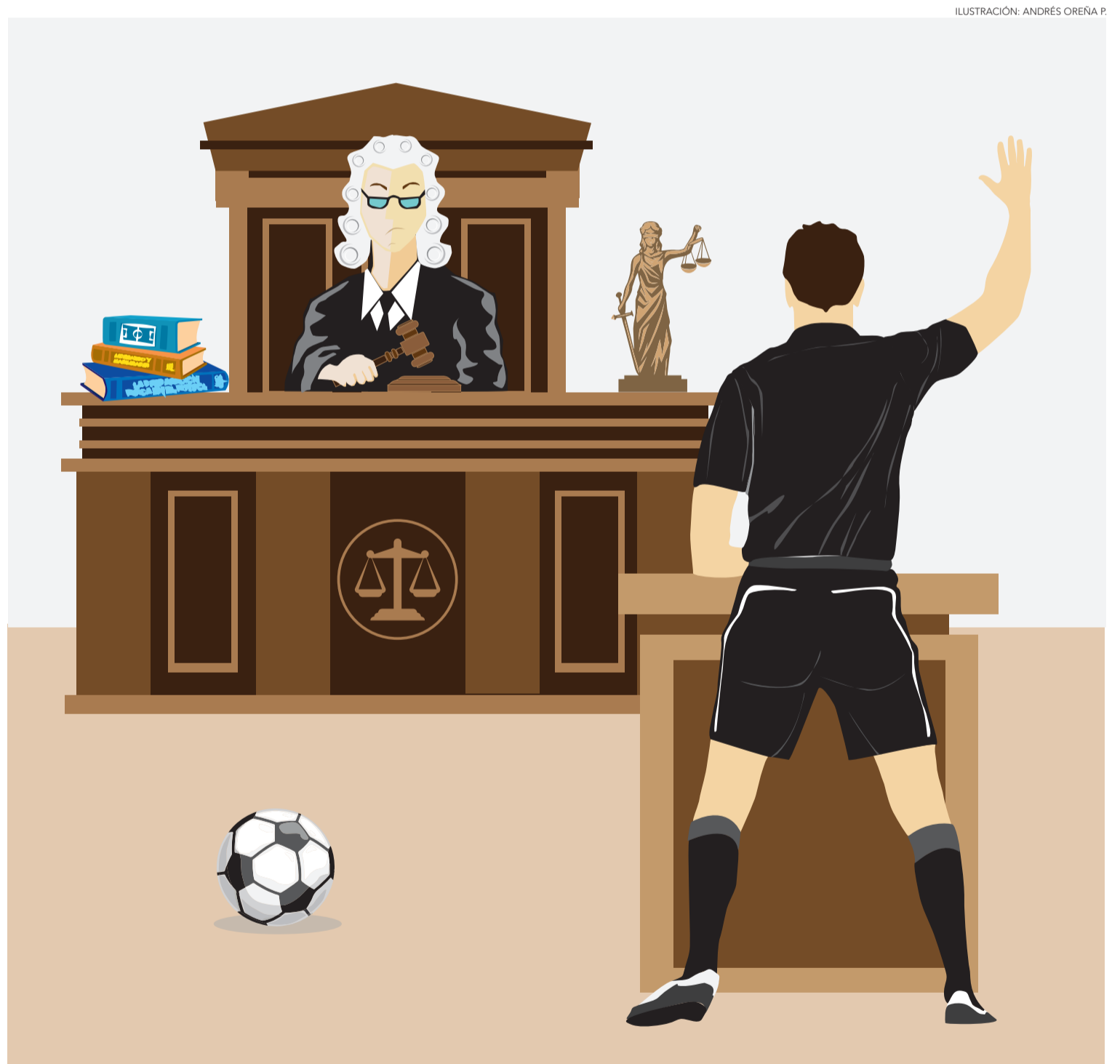
ILUSTRACIÓN: ANDRÉS OREÑA P.

Además del Inaf, que en la zona funciona en la U. Federico Santa María, existen otros cursos como el Carfuc (Cuerpo de Árbitros de Fútbol de la Universidad de Concepción). “Esa fue la cuna del arbitraje. Desde el año 1998 hasta hace tres años fui profesor ahí. Realizábamos los cursos de formación de árbitros cuando no estaba el Inaf. Partir en el Carfuc es un camino tan válido como iniciarse como árbitro en el fútbol amateur o la Copa Essbio, pero sí o sí hoy debes pasar por el