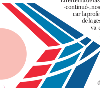
ILUSTRACIÓN: ANDRÉS ORENANA P.

Mismos propósitos dijo tener el seremi en el plano local. “A nivel regional, tenemos muchas federaciones con las que queremos trabajar cercanamente, aún no hemos sido capaces de reunirnos con todos porque obviamente hay que darse una vuelta bastante larga, pero ya estamos trabajando en el desarrollo de las capacitaciones que nosotros queremos realizar con las distintas federaciones. En eso nos puede ayudar bastante el Coch, que tiene distintas vías de capacitación que ya nos han ofrecido para