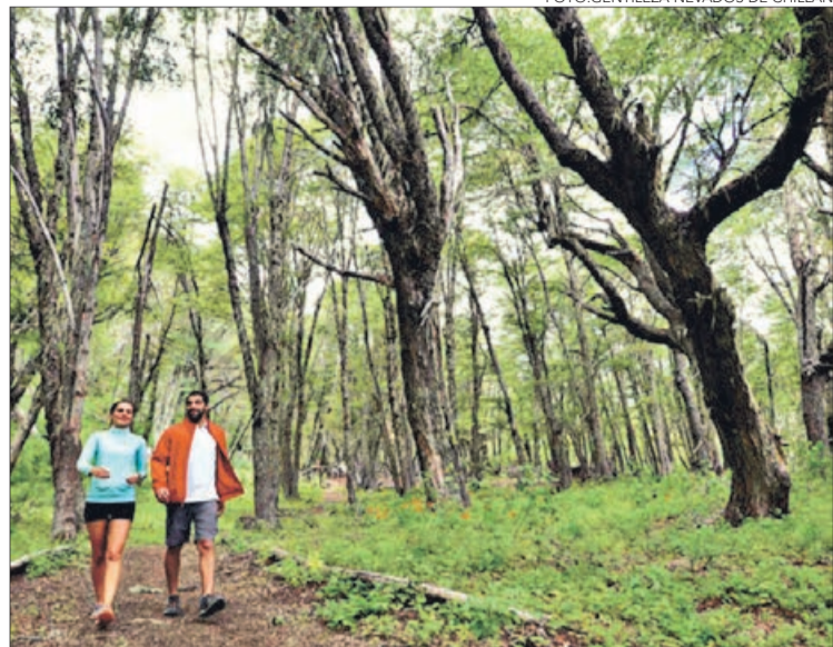
ACTIVIDAD permite conectarse con un privilegiado entorno natural.