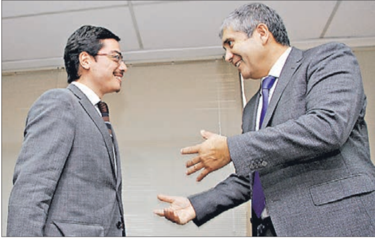
PEÑA es ex alumno de la UdeC de la carrera de Administración Pública.