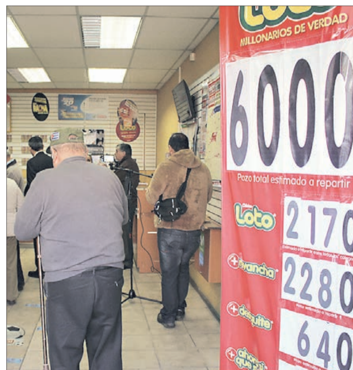
Muchas personas se han acercado a comprar un cartón de Loto esperando ser los ganadores de los 6.000 millones de pesos.

Durante todo el día se pueden adquirir los cartones del Loto para el sorteo más grande en lo que va del año. Pueden ser adquiridos en cualquier punto de venta de Polla Chilena, el sorteo se realizará a las 22 horas.