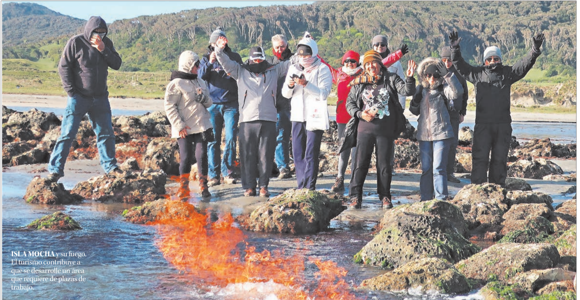
ISLA MOCHA y su fuego. El turismo contribuye a que se desarrolle un área que requiere de plazas de trabajo.