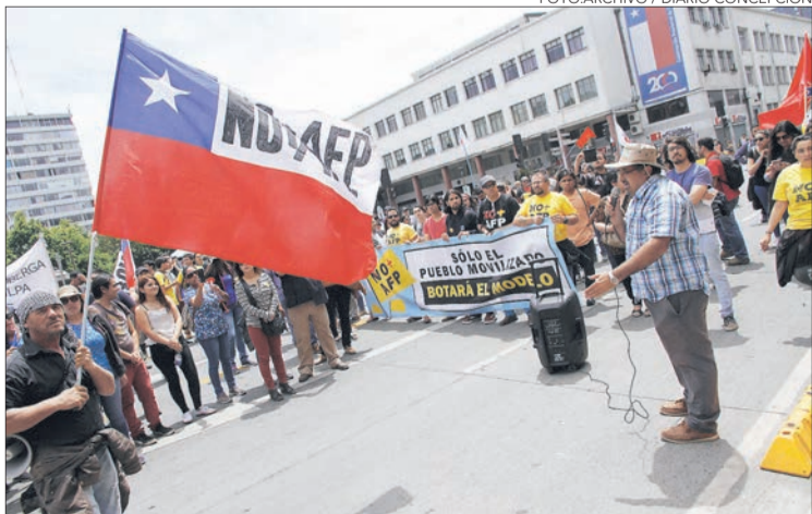
“NO MÁS AFP” llamó a una movilización a nivel nacional.