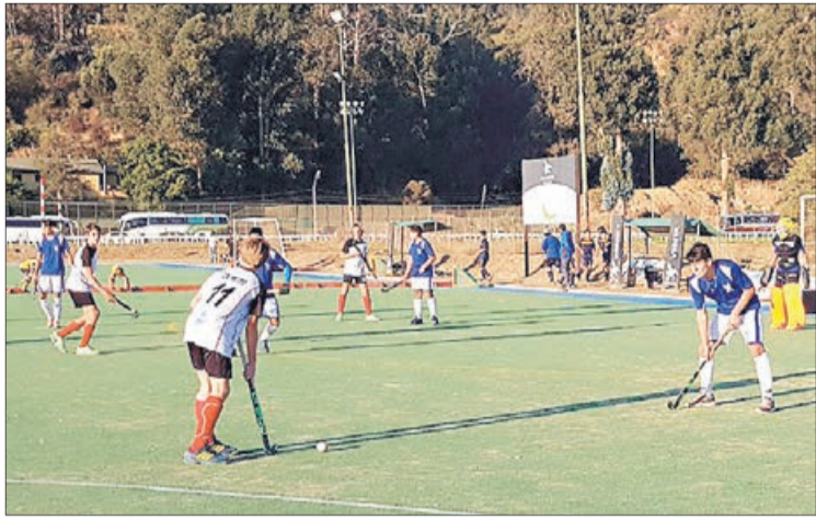
PRIMERA JORNADA del torneo se disputó en Viña del Mar.