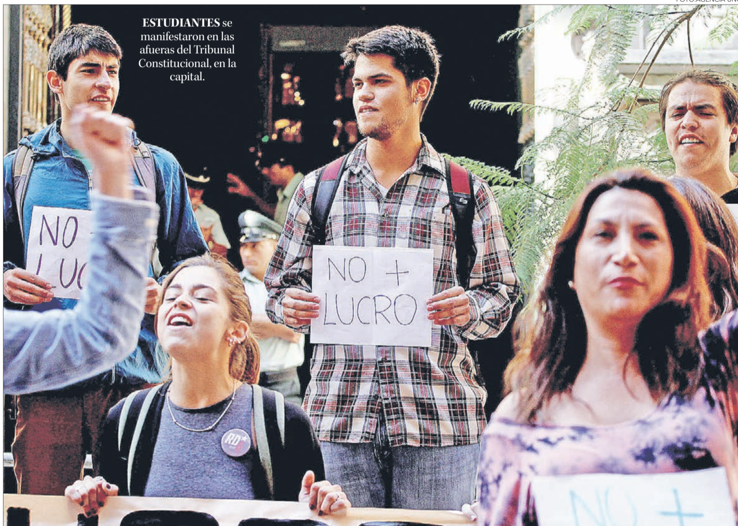
ESTUDIANTES se manifestaron en las afueras del Tribunal Constitucional, en la capital.

Finalmente, prosperó la indicación presentada por las universidades privadas, lo que vuelve inconstitucional que sostenedores de instituciones de educación superior tengan prohibición de lucrar. Estudiantes marcharán el 19 de abril.