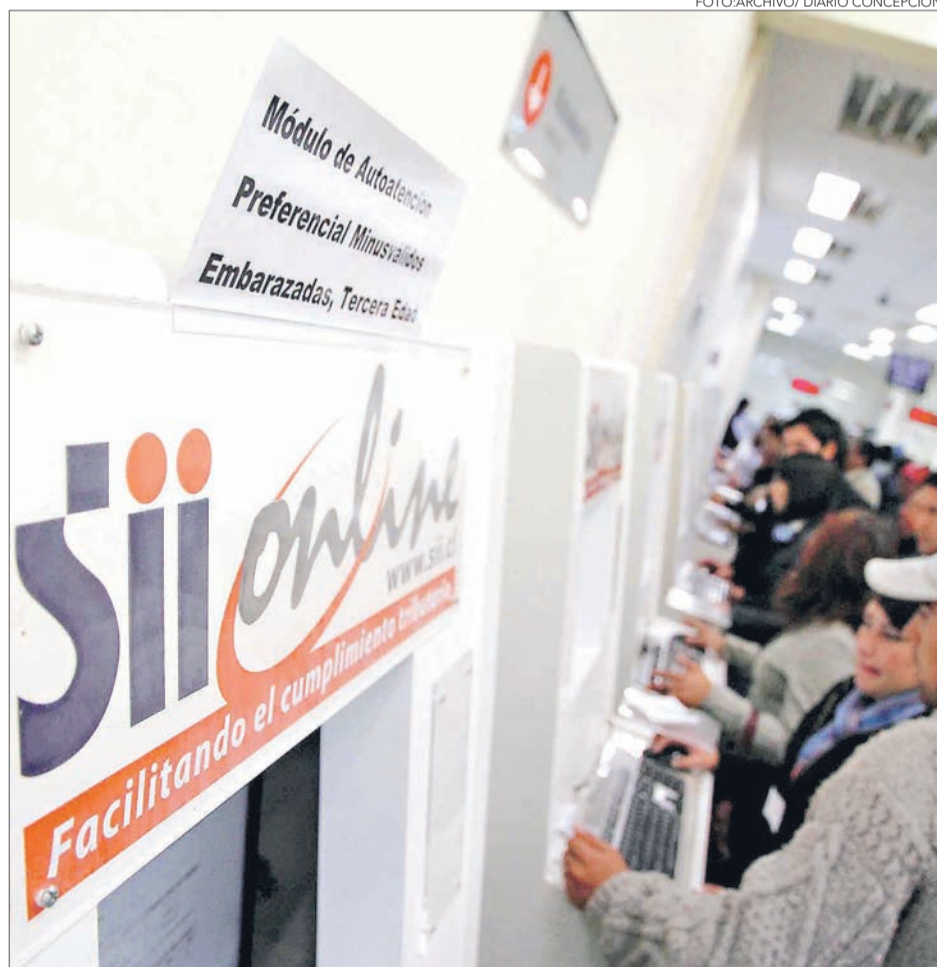
CONTADORES plantean que sitio web del SII no se encuentra bien preparado para el proceso.