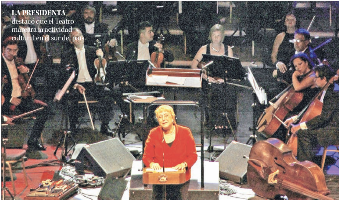
LA PRESIDENTA destacó que el Teatro marcará la actividad cultural en el sur del país.

Molestia generó en personeros de Chile Vamos que, en el discurso de Michelle Bachelet, no se hiciera alusión a lo obrado en el primer