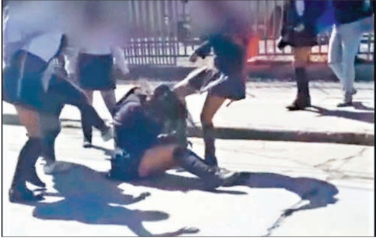
FOTO-CAPTURA DE IMAGEN