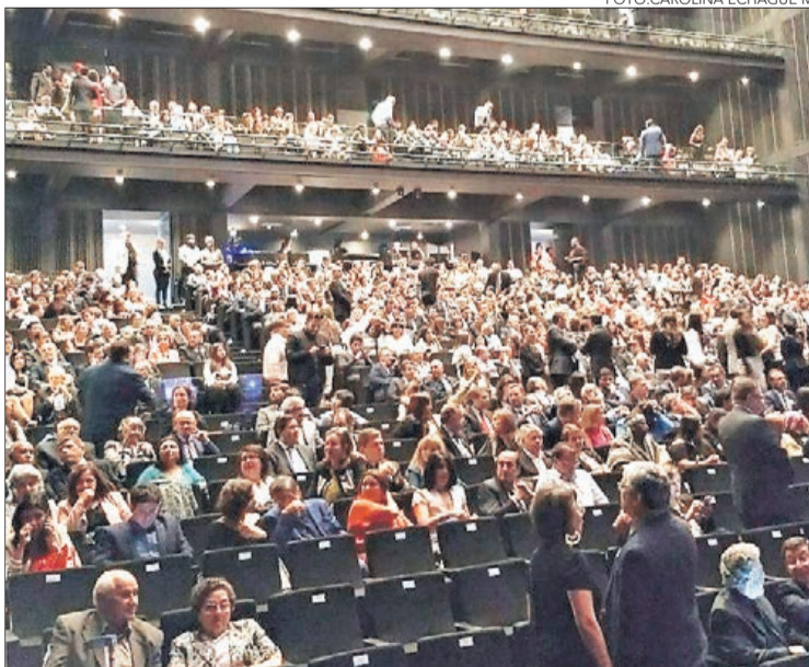
LA SALA PRINCIPAL del recinto se llenó para el acto de apertura.