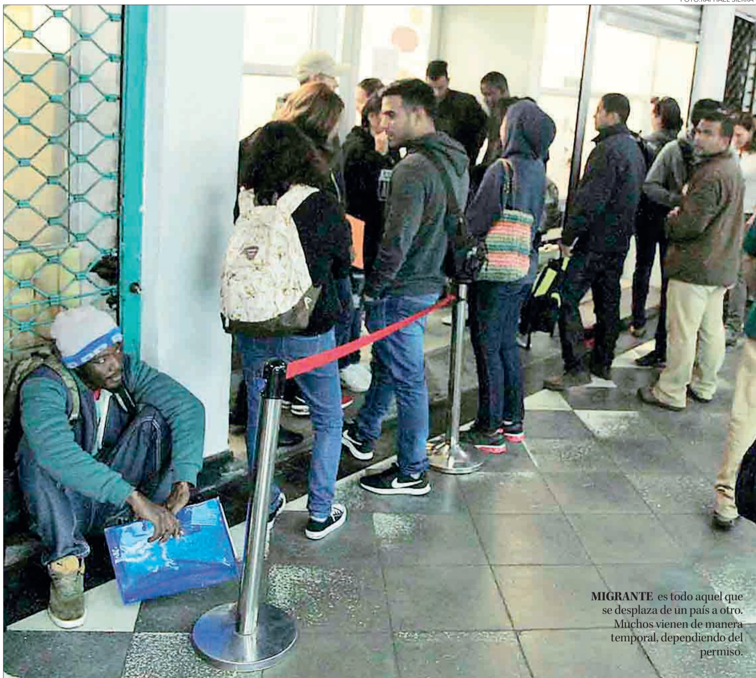
MIGRANTE es todo aquel que se desplaza de un país a otro. Muchos vienen de manera temporal, dependiendo del permiso.