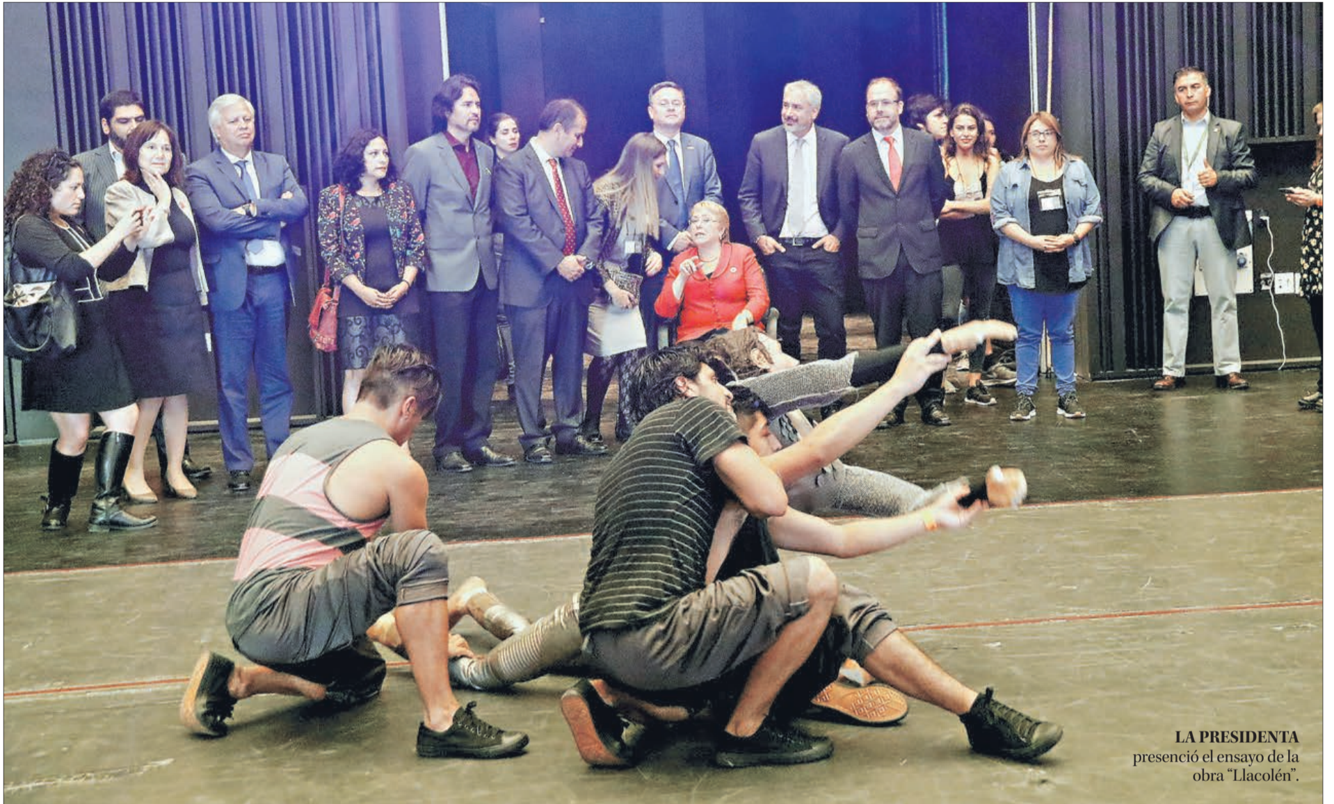
LA PRESIDENTA presenció el ensayo de la obra "Llacolén".

M. Maldonado y R. Cárcamo contacto@diarioconcepcion.cl