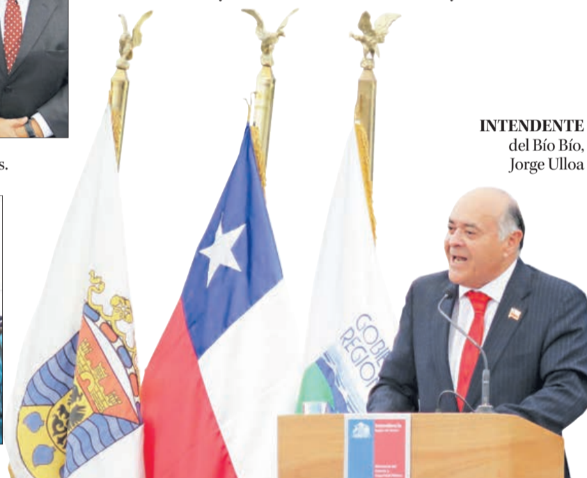
INTENDENTE del Bío Bío , Jorge Ulloa