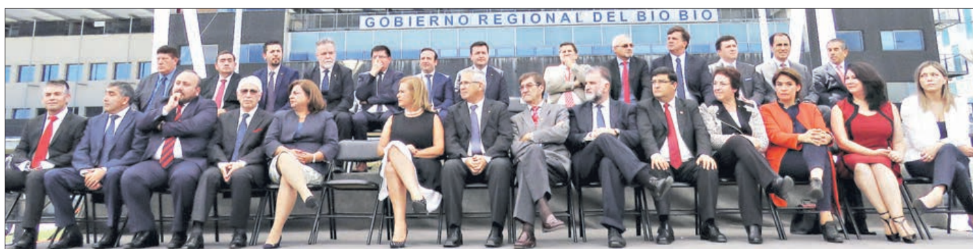
JURAMENTOS de nuevos cores del Bío Bío