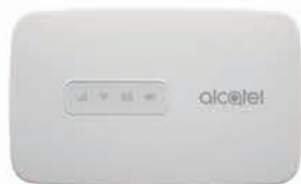
Alcatel Modem Mifi MW41N