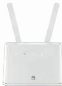
Huawei Router B310