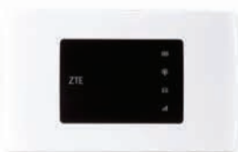
ZTE Modem Mifi MF920T