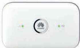
Huawei Modem Mifi E5573