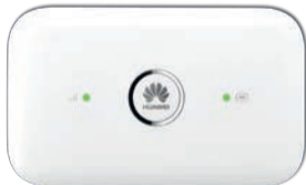
Huawei Modem Mifi E5573