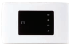
ZTE Modem Mifi MF920T