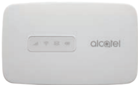
Alcatel Modem Mifi MW41N