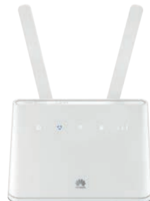
Huawei Router B310