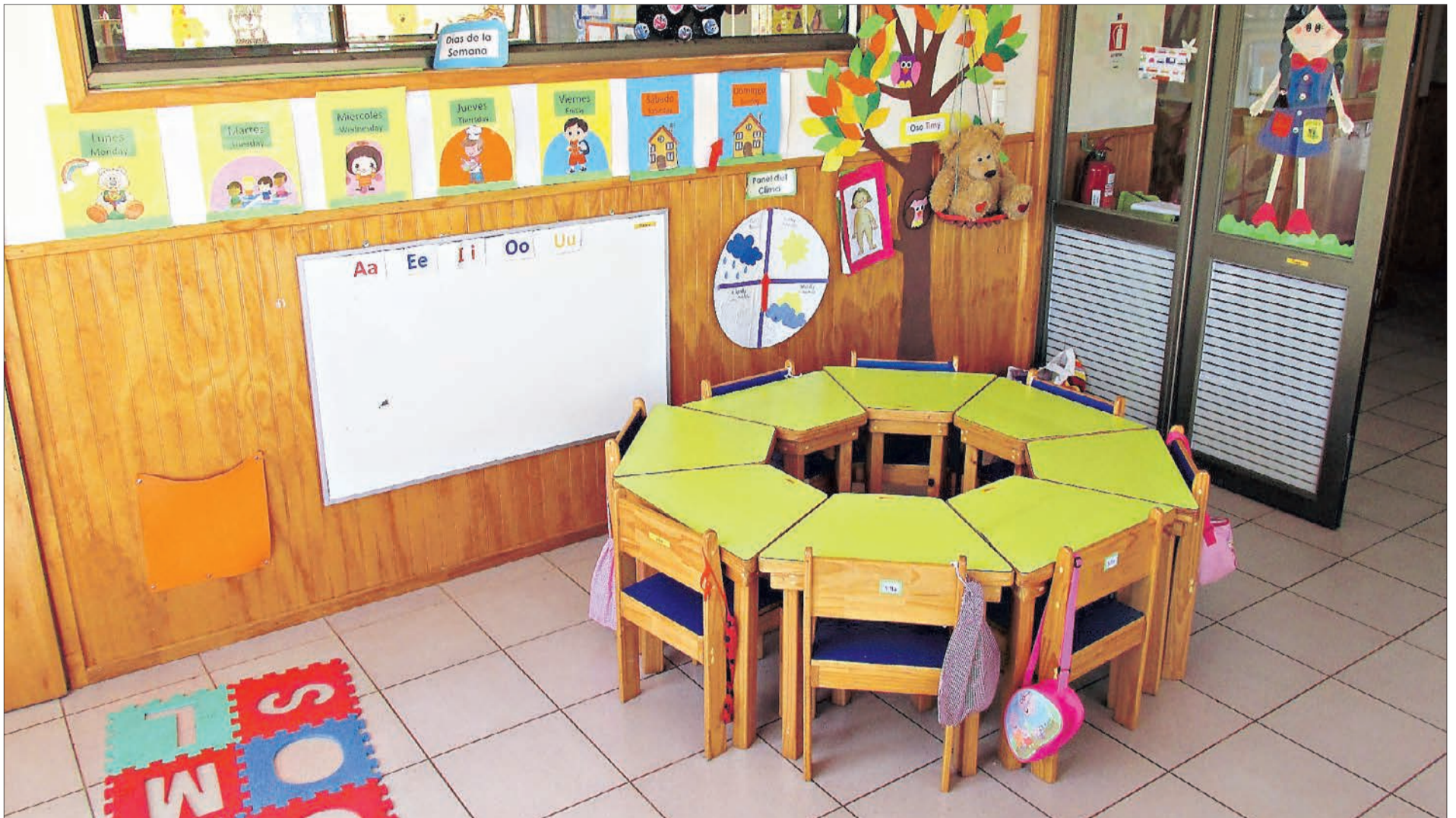
SALA CUNA Y JARDÍN INFANTIL CLARILUZ