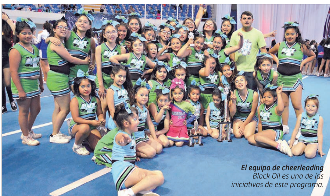
El equipo de cheerleading Black Oil es una de las iniciativas de este programa.

ría y Pastelería, Montaje Mecánico, Maestro Civil de Mantenimiento, Instalación de Piso Flotante y Cerámicos, Garzón, Elaboración de Telares y Manipulación de Alimentos.