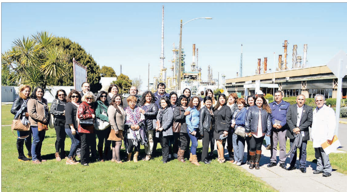
En convenio con los centros de Padres y Apoderados se desarrolla el programa Primero Lee.

En materia de capacitación y con el objetivo de entregar herramientas de habilitación laboral para diversos oficios, solo en 2017 se abrieron cupos para 250 vecinos en 14 cursos ya sea a través de franquicia Seneca o con modalidad precontrato. Estos fueron: Cuidado de manos y Pies, Soldadura, Carpintería, Electricidad, Instalación de Paneles Fotovoltaicos, Conducción de Grúa Horquilla, Montaje de Cañerías, Panade-