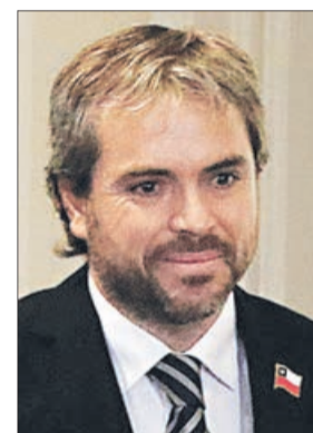
Gonzalo Blumel M. Sec. Gen. de la Presidencia