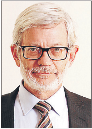
Juan Andrés Fontaine Ministerio de Obras Públicas