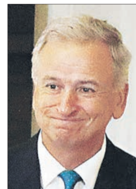
Felipe Larraín Ministerio de Hacienda