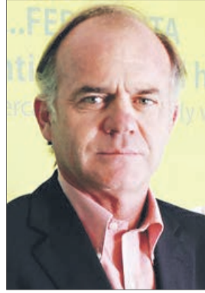
Antonio Walker Ministerio de Agricultura