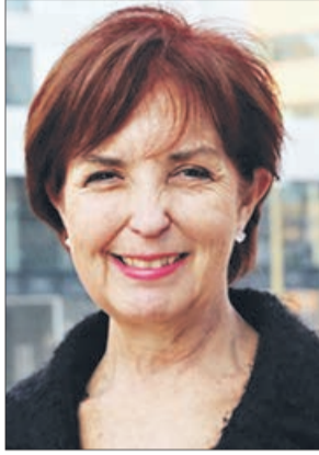
Gloria Hutt Ministerio de Transportes