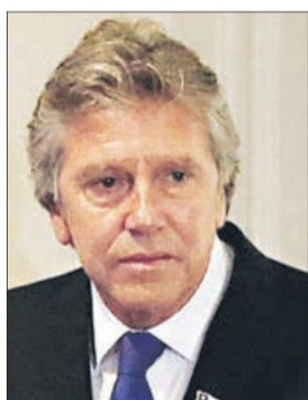
Alberto Espina Ministerio de Defensa