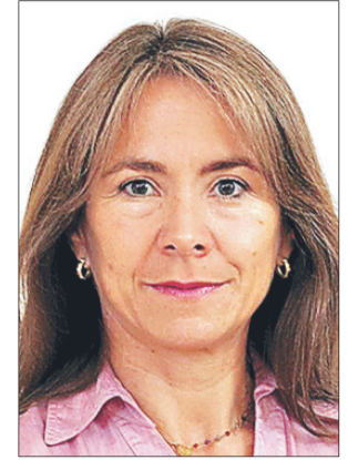
Susana Jiménez Ministerio de Energía