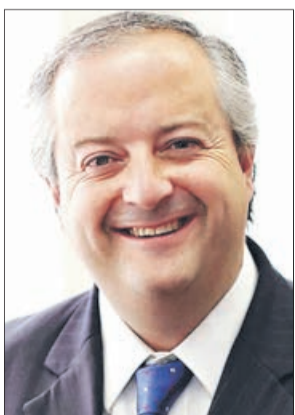
Nicolás Monckeberg Ministerio del Trabajo

"Me parece poco prudente que una ex autoridad haga estas críticas sin haber asumido. No me parecen prudente y manifiestan su intención por la Municipalidad de Concepción", dijo.