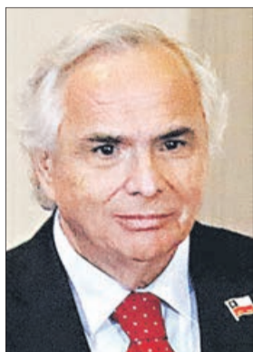
Andrés Chadwick Ministerio del Interior

6 nombres se repiten del primer Gobierno piñerista. Fontaine, Chadwick, Pérez, Ampuero, Larraín y Moreno.