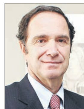
Hernán Larraín Ministerio de Justicia