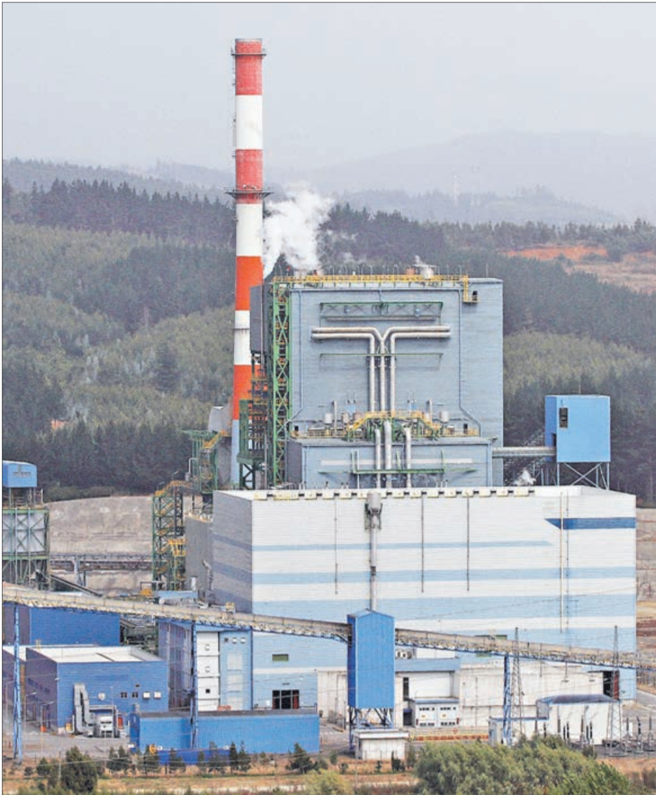
LA FIRMA informó que está estudiando los antecedentes.

CERCA DE MIL VECINOS RECLAMARON ANTE LA SMA