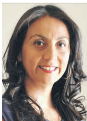
Cecilia Pérez Min. Sec. General de Gobierno