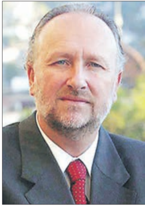
Baldo Prokurica Ministerio de Minería