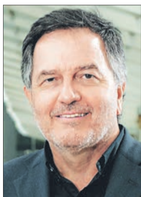
Roberto Ampuero Ministerio de R. Exteriores