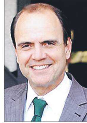
Cristián Monckeberg Ministerio de Vivienda