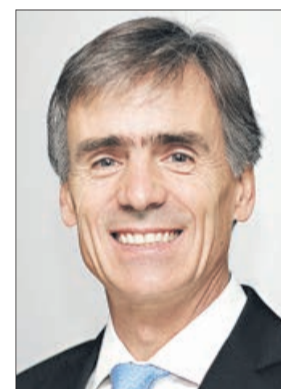
José Ramón Valente Ministerio de Economía