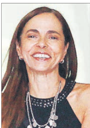
Isabel Plá Ministerio de la Mujer