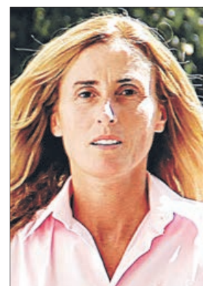
Marcela Cubillos Ministerio del Medio Ambiente