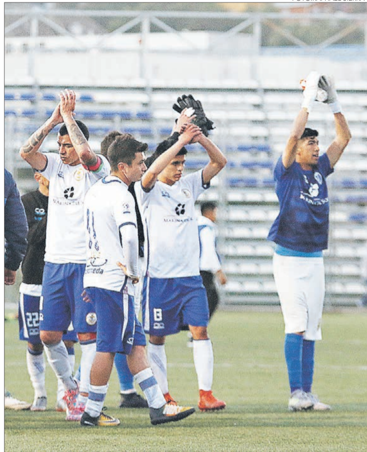
NAVAL ES EL MÁS COMPLICADO. La Sociedad Anónima corrió por las suyas y apostó todo a Segunda División, pero podría quedarse sin nada.

Twitter @DiarioConce contacto@diarioconcepcion.cl