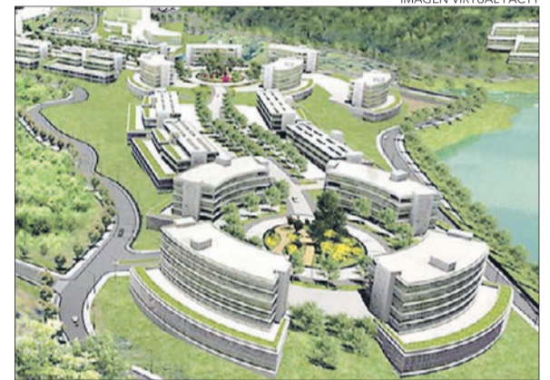
IMAGEN VIRTUAL PACYT