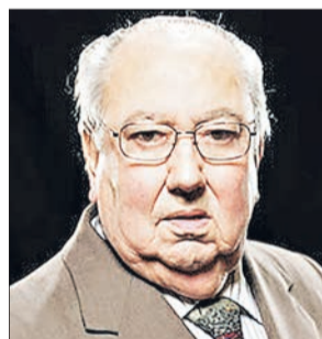
Roberto Goycoolea, premio nacional de Arquitectura 1995.

En la instancia se realizará un reconocimiento a su vida académica, trayectoria profesional y aporte a la capital regional donde se realizará una muestra retrospectiva que da cuenta de sus hitos y una revisión cronológica de sus obras más destacadas en el ámbito urbano, arquitectónico, docente y de investigación.