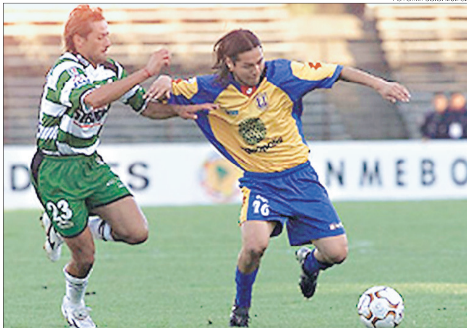
UDEC JUGÓ UNA vez la Copa Libertadores. Fue el 2004, contra Santos Laguna, Caracas y el Cruzeiro de Rivaldo. Copa Sudamericana, en tanto, la disputó el 2004, 2015 y 2016.