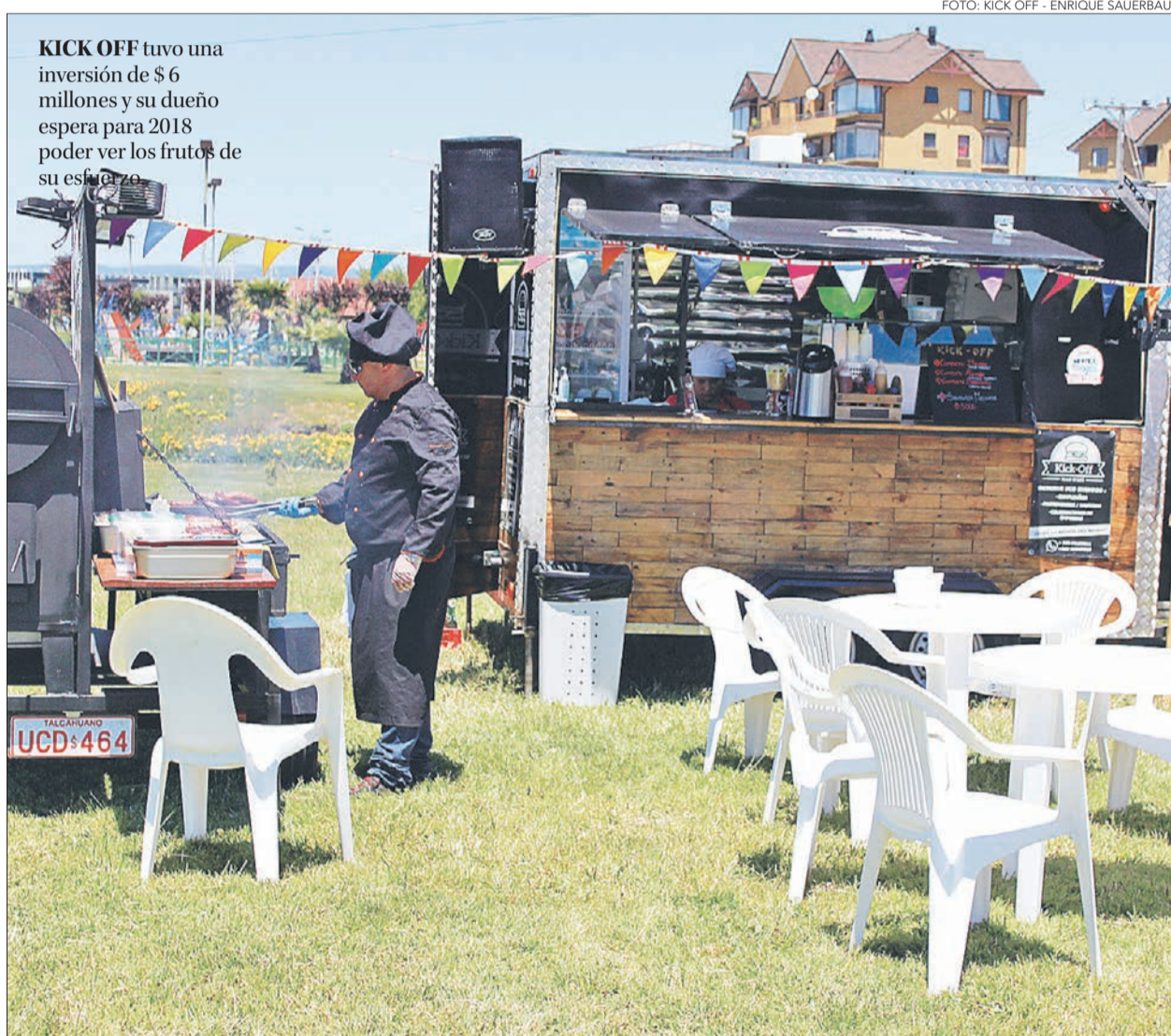
KICK OFF tuvo una inversión de $6 millones y su dueño espera para 2018 poder ver los frutos de su esfuerzo.

Una inversión promedio de cerca de $6 millones y un cúmulo de trámites que sortear son parte del negocio de los camiones de comida hoy día en la zona.