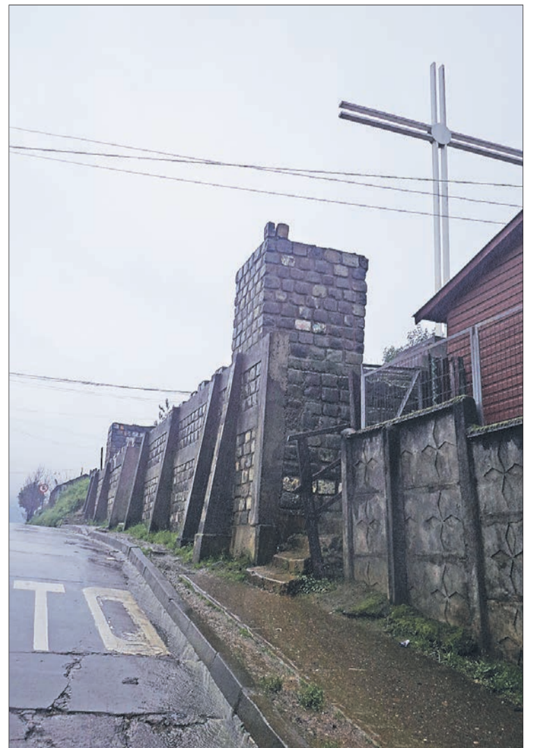
ANGOL: Fundado el 24 de octubre de 1553.