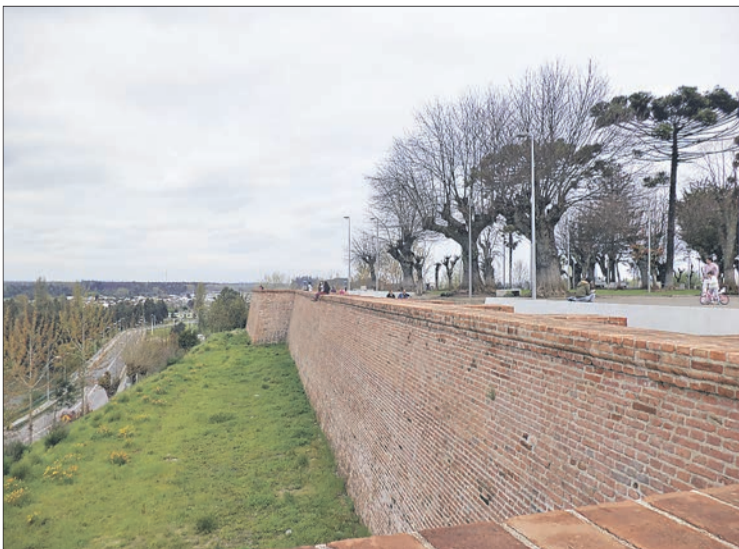
NACIMIENTO: fundado en diciembre de 1603, por don Alonso de Ribera.

Los restos de estos fuertes -bien o mal restaurados- siguen allí para recordarnos nuestro pasado militar y permitirnos entender mejor nuestro especial carácter tan represivo y violento a veces y tan obediente, estoico y disciplinado, en otras ocasiones. En definitiva, contarnos un poco más de quienes, en esencia, somos los chilenos.