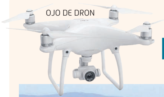
OJO DE DRON