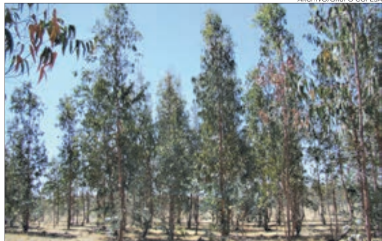
EL EUCALIPTO y su impacto sobre la economía será parte de los análisis.