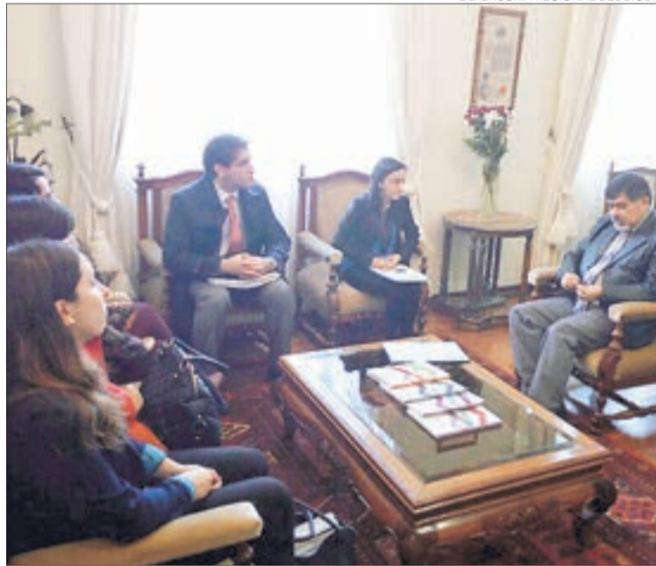
DEFENSORIA REGIONAL DEL BÍO-BÍO

“En el escrito, explicábamos por qué tenemos el derecho a ser oídos, citando una serie de normas, incluida la Constitución. Pero nuestra solicitud fue rechazada en una resolución de apenas tres líneas”, dijo el abogado, quien aseguró que se concentrarán en cómo lograr ser