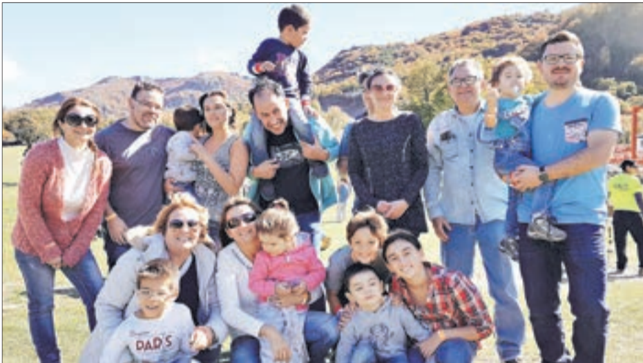
FAMILIA HORMAZABAL – CAROCA.

Por segundo año consecutivo llegaron a “Familandia” cientos de familias junto a sus hijos, quienes disfrutaron en Nevados de Chillán de diversas actividades de animación, magia, payasos, carreras de niños, y al final de la actividad pudieron plantar un árbol junto a sus padres.