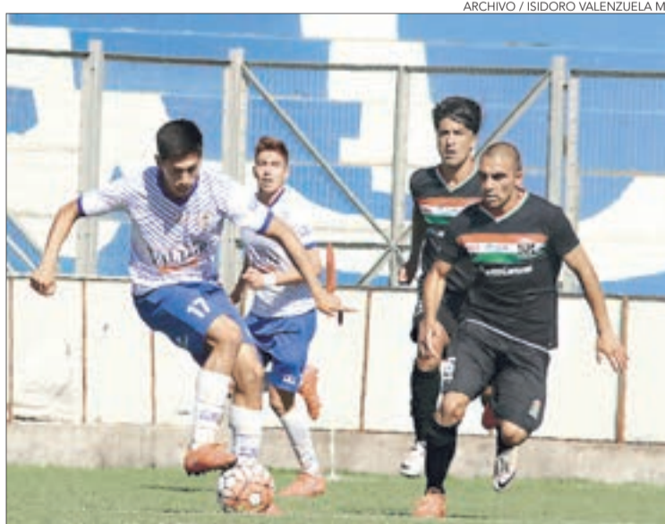
EL AÑO PASADO jugaron sin público en El Morro. Mañana será distinto.

Twitter @DiarioConce contacto@diarioconcepcion.cl