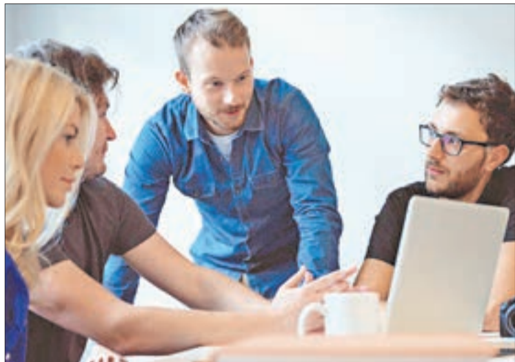
BENEFICIADOS recibirán apoyo en actividades de desarrollo profesional.