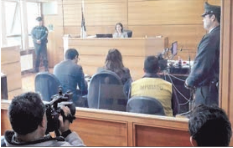
EL HOMBRE fue formalizado ayer en el juzgado de Garantía de Tomé.