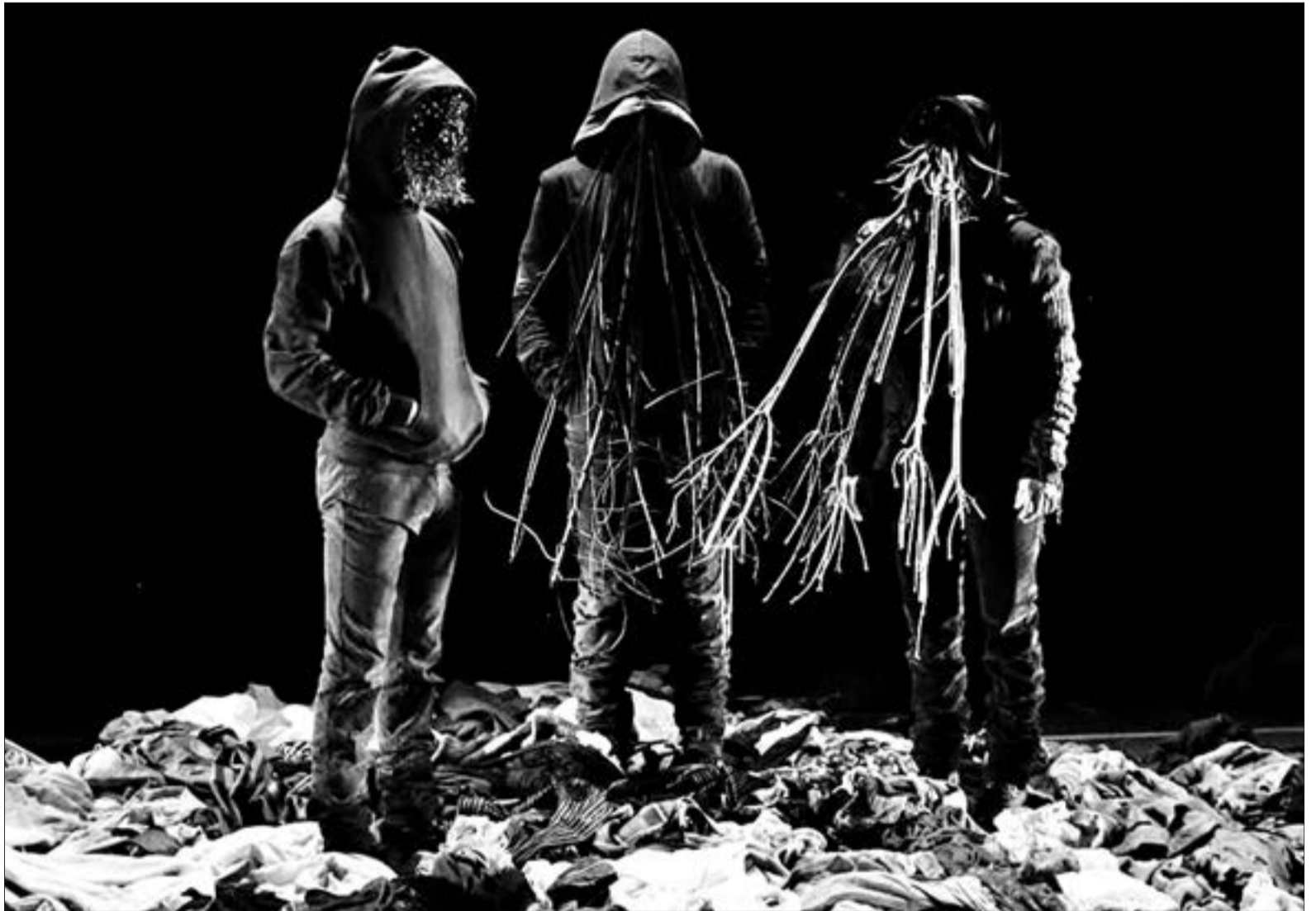
LA OBRA EN POCO más de una hora trata el tema de la inmigración y también sobre la memoria y el exilio.