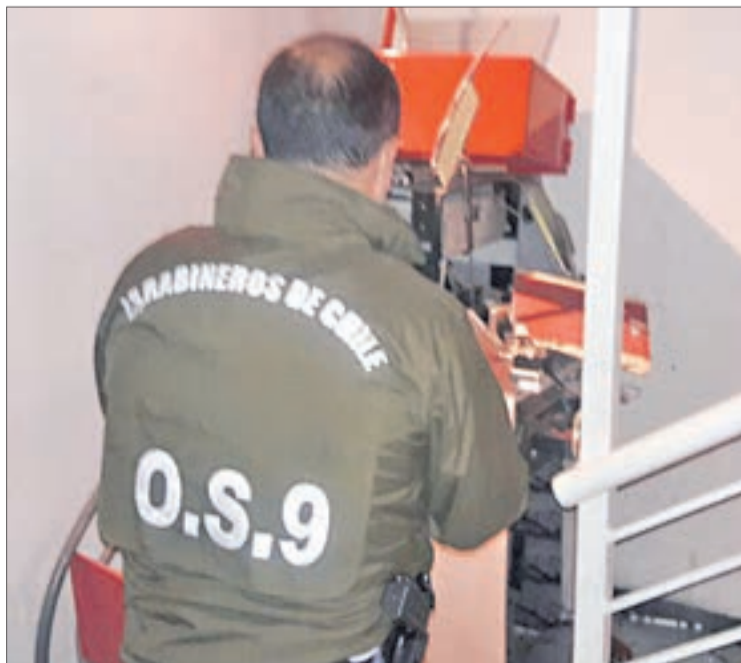
EL OS-9 DE CARABINEROS y Labocar trabajaron en los peritajes en el lugar.

El grupo huyó en un vehículo robado, el que dejaron abandonado junto con el dinero, ya que funcionó el método de entintado de billetes.