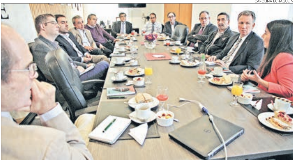
ESTUVIERON presentes rectores de la UdeC y Ucsch, además de gerentes generales de socios Irade y académicos.

Se trata del primer evento del ciclo "En Confianza" que busca crear puentes entre el mundo público, privado y académico de la Región del Bío Bío.