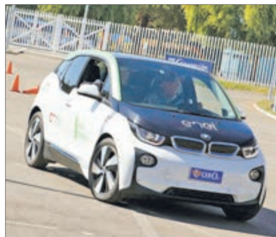
EN ACCIÓN EL AUTO ELÉCTRICO BMW, que puede acelerar a 170 k/h y será una de las atracciones del día.

co que logramos acondicionar y dejar completamente listo”, apuntó.