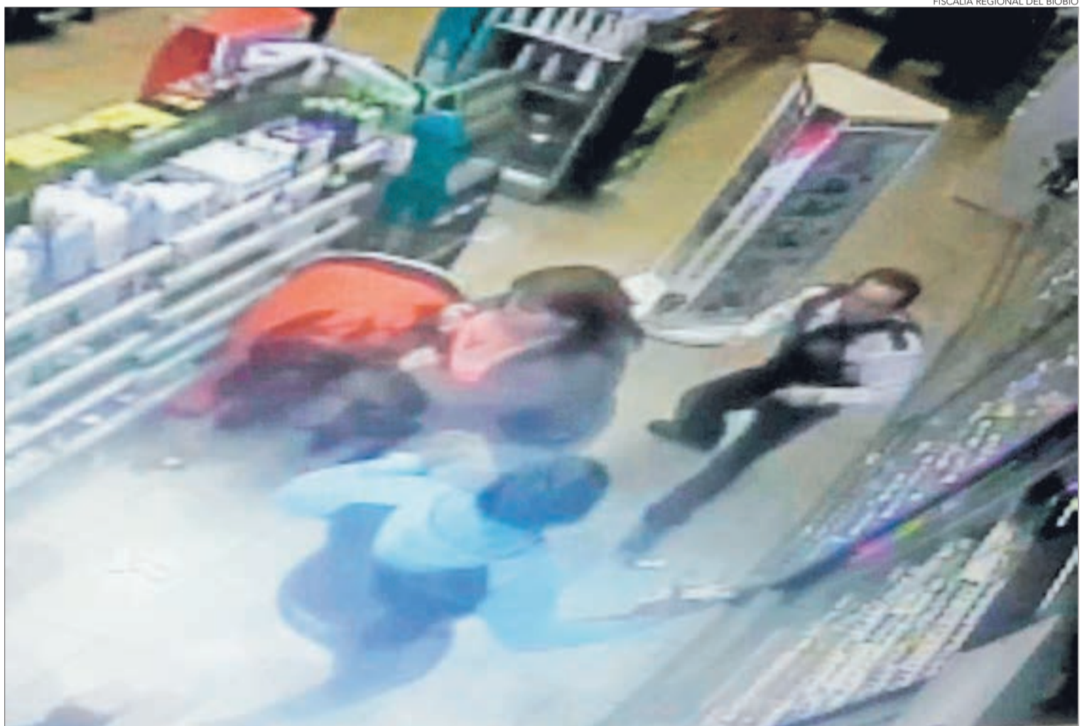
FISCALIA REGIONAL DEL BÍO BÍO

La banda fue detenida tras allanamientos simultáneos en Chiguayante. El accionar quedó registrado en las cámaras de seguridad de las farmacias. Los robos se cometieron en octubre y noviembre de 2016.