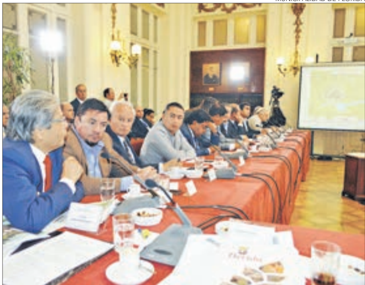
EN REUNIÓN CON la comisión de Agricultura del Senado.