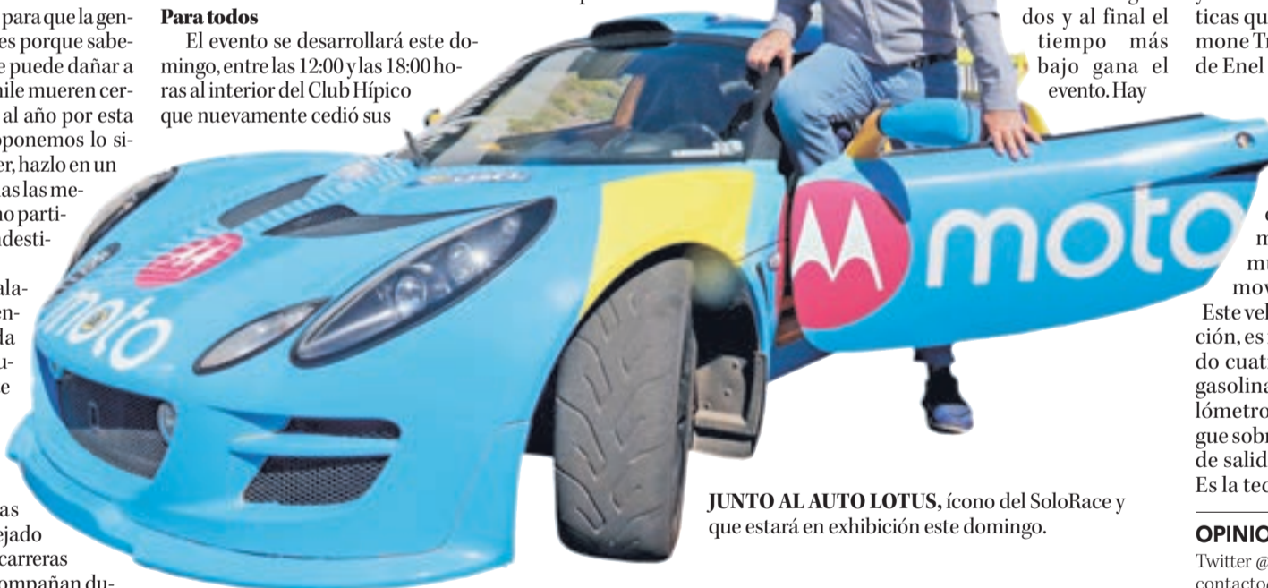
JUNTO AL AUTO LOTUS, ícono del SoloRace y que estará en exhibición este domingo.

instalaciones para la jornada. Algo que Eliseo Salazar quiso destacar. “En las ciudades donde nos presentamos, lo hacemos como una intervención urbana, ya sea en estacionamientos de mall, estadios y casinos. Aquí encontramos un cartódromo en el club hípi-