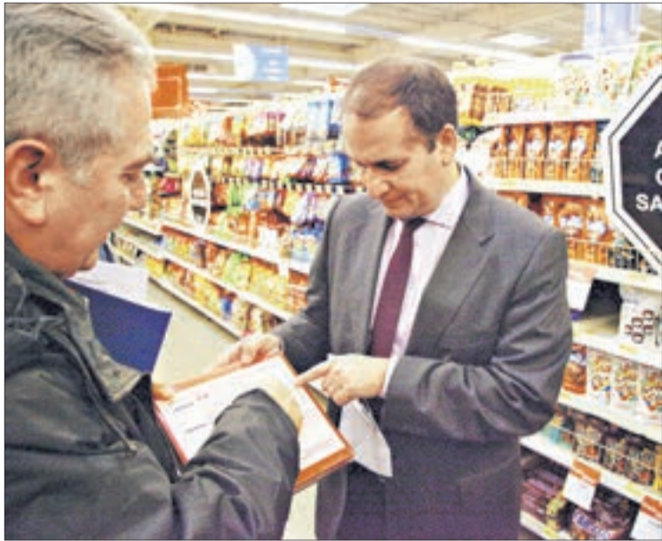
SEREMI DE SALUD

AUTORIDADES YA HAN efectuado 286 inspecciones y 85 sumarios.