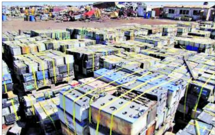
BATERÍAS USADAS son las que se reciclarían en esta nueva planta.