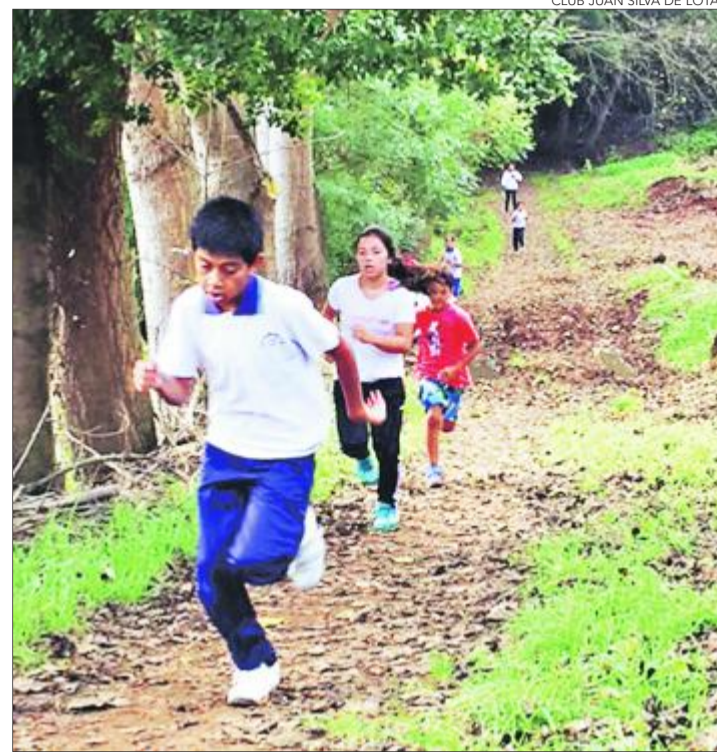
CLUB JUAN SILVA DE LOTA

Twitter @DiarioConce contacto@diarioconcepcion.cl