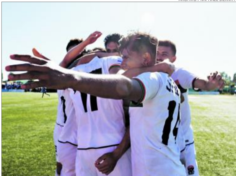
ABRAZOS MINEROS en un equipo que no ganaba desde enero.