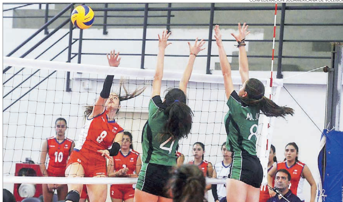
CONFEDERACIÓN SUDAMERICANA DE VÓLEIBOL