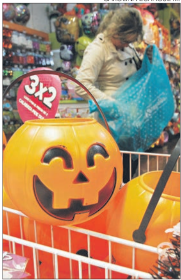
FESTIVIDADES generan gran oferta de trabajos temporales.